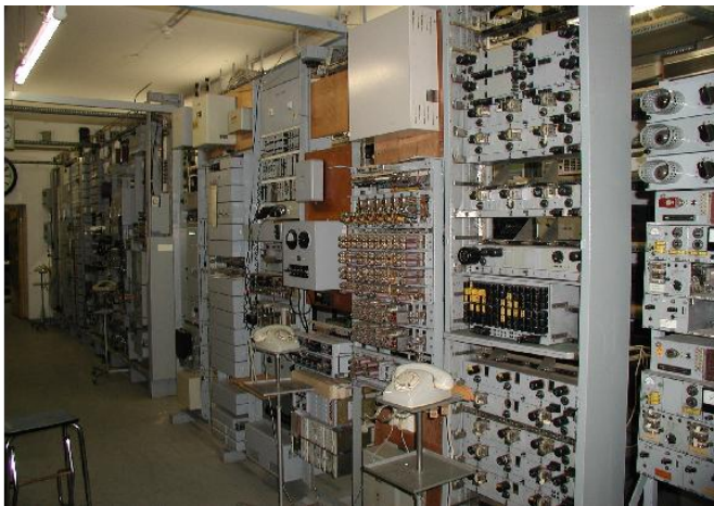
Bahnselbstanschlussanlage Basa EB V