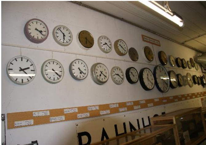
Alle 24 Zeitzonen der Welt und diverse Zwischenzeiten dargestellt