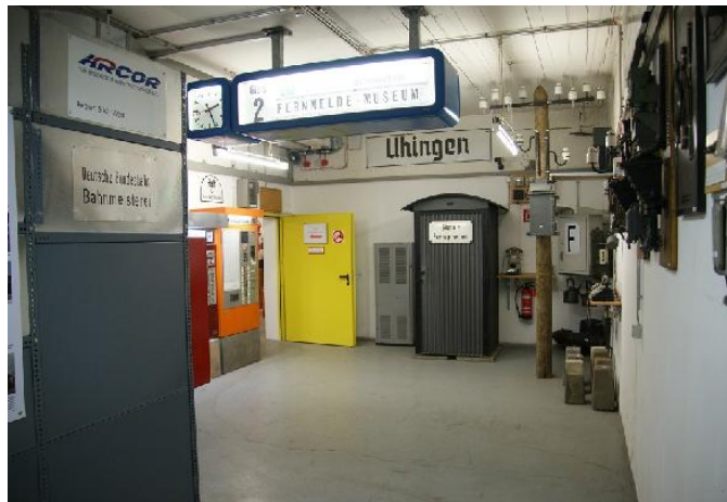
Fernsprechbude mit einer funktionierenden Freileitung